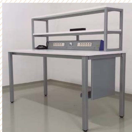
Mesa de informática. PARQUE ESCOLAR – PORTUGAL