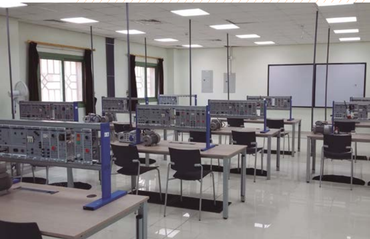
Aula de automatismos eléctricos. COE ASIR – ARABIA SAUDI