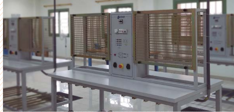
Laboratorio de instalaciones eléctricas. COE MUHAYIL – ARABIA SAUDI