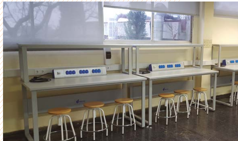
Aula de informática. CIFO LA VIOLETA – CATALUÑA