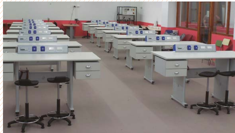
Aula de electricidad. ESCOLA FONSECA BENEVIDES – PORTUGAL