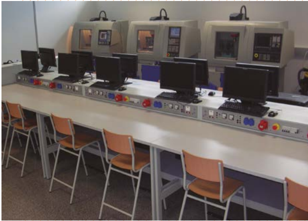
Laboratorio de control numérico. Federación empresarios del metal. MURCIA