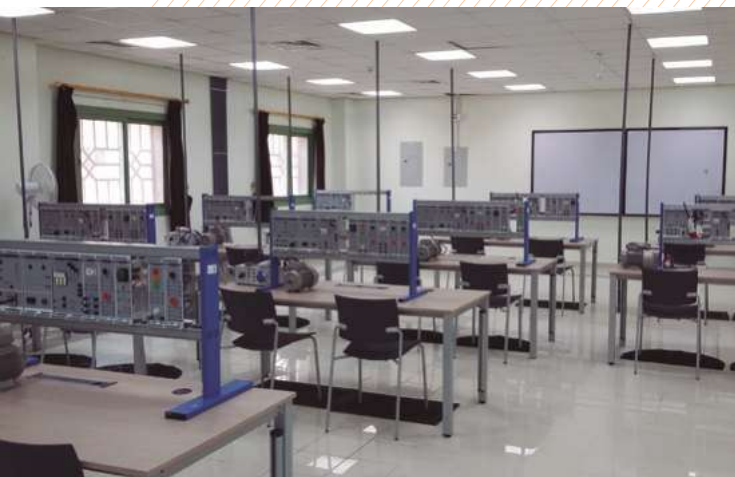
Aula de automatismos eléctricos. COE ASIR – ARABIA SAUDI