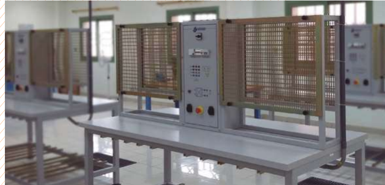
Laboratorio de instalaciones eléctricas. COE MUHAYIL – ARABIA SAUDI