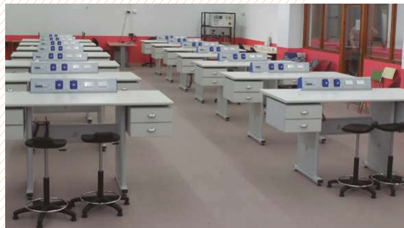
Aula de electricidad. ESCOLA FONSECA BENEVIDES – PORTUGAL