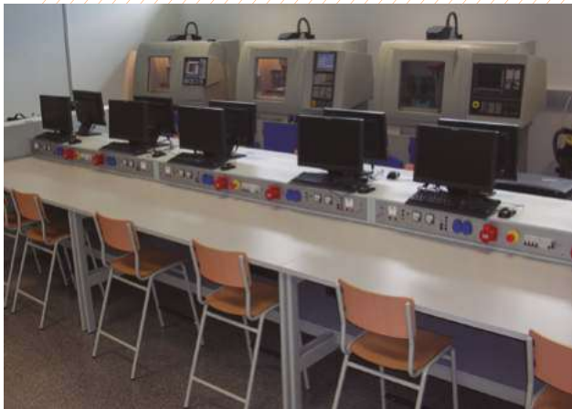
Laboratorio de control numérico. Federación empresarios del metal. MURCIA