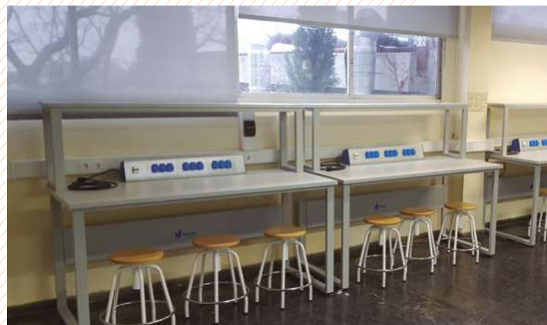
Aula de informática. CIFO LA VIOLETA – CATALUÑA